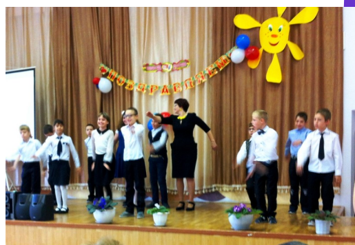
Учащиеся 3 а класса