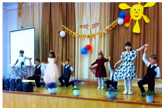
Учащиеся 2 а класса